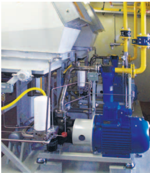
Два дожимных компрессора COMPEX 18 в климатическом исполнении на Боголюбовском нефтяном месторождении, Оренбургская область

Экономичность в процессе эксплуатации и высокие экологические стандарты дожимных компрессоров COMPEX достигаются благодаря применению замкнутого масляного контура с масляным фильтром. За счет этого существенно сокращен расход масла и объем масляной системы, что позволяет существенно снизить затраты на техническое обслуживание. Например, для компрессора COMPEX мощностью 75 кВт объем масляной системы составляет всего 45 л, тогда как у аналогов других производителей 100–400 л.