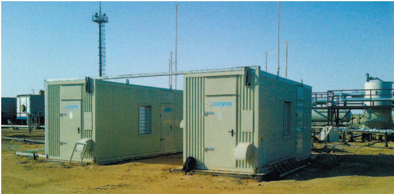
Дожимные компрессоры COMPEX 110 для компримирования попутного нефтяного газа на месторождении «Сарыбулак» в Казахстане

Сейсмостойкость COMPEX составляет 8 баллов по шкале МСК-64. Низкий уровень шума и вибраций при эксплуатации исключают необходимость строительства специального фундамента для компрессорных станций и позволяют сократить капитальные затраты на строительство. Все компрессоры оснащены современными контроллерами, которые обеспечивают надежную и безопасную работу оборудования в автоматическом режиме с возможностью локального и удаленного управления и мониторинга рабочих параметров.